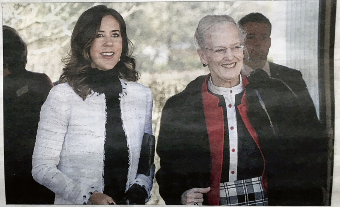
Dronning Margrethe og kronprinsesse Mary gæstede tirsdag Greve Museum i anledning af, at det var 90 år siden, at Håndarbejdets Fremme, som Dronningen er protektor for, blev stiftet.

"Det er en meget stor glæde at være til stede her på Håndarbejdets Fremmes 90-års fødselsdag på Greve Museum. Jeg har glædet mig til det, og jeg har ikke kunnet dy mig for at lave noget, som kan glæde mange af dem, der følger Håndarbejdets Fremme."