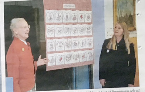
Håndarbejdets Fremmes jubilæumsværk "Victoria" blev afsløret af Dronningen, selv til stor jubel fra de fremmødt, der talte flere hundrede, der i årenes løb har udstillet ved Håndarbejdets Fremme.