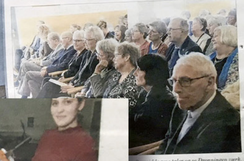
Lørdagsmiddagens taler og af Dronningen værktøjs.